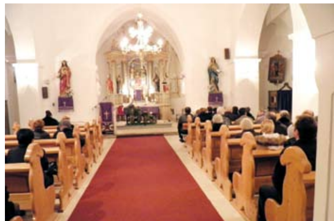
Vjernici na misi u Župnoj crkvi Presvetog Trojstva u Radoboju povodom blagdana sv. Barbare.

Naglasio je pri tom da su radobojski rudari još prije 170 godina otvorili vrata znanja svojoj djeci i da to trebamo i danas činiti, jer bez znanja nema napretka i boljeg života. Prisutni vjernici, uglavnom članovi obitelji nekadašnjih rudara, koji su se okupili 4. prosinca u Župnoj crkvi pomolili su se za duše svojih pokojnika i za zdravlje još uvijek živih rudara s našeg područja. (vir)