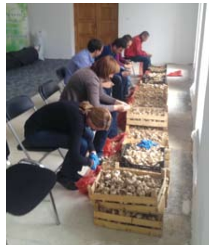
Prvi su koraci učinjeni vjerujemo da vode u pravom smjeru.

Općina i PZ Radoboj početi će s akcijom upoznavanja poljoprivrednika s mogućnostima i koristima proizvodnje češnjaka i organizirati kooperaciju te otkup proizvedenih količina. Usporedno će se raditi na osiguranju prodaje preko trgovačkih kuća, a neke su već pokazale interes za otkup. Inicijativa je hvale vrijedna i za pretpostaviti je da će donijeti željene rezultate, a zasađena površina južno od nogometnog igrališta ujedno je i odgovor znatijeljnima, koji postavljaju pitanje zašto Općina troši novce za kupnju nekorisnog zemljišta. Naime na kupljenom zemljištu djelatnici zaposleni u Jedinštvu upravnom odjelu i radnici na obavljanju društveno korisnih poslova u Općini Radoboj zasadili su tisuće češnja bijelog luka, što bi trebala biti osnova za isplativu proizvodnju u mnogim poljoprivrednim domaćinstvima. (m.m.)