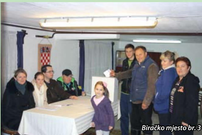
Biračko mjesto br. 3

Rezultati po naseljima: Gornje Jesenje; od upisanih 598 glasača, glasovalo je 247 (200 ZA, 44 PROTIV, tri listića bila su nevažeća). Donje Jesenje; upisano je 294 glasača, glasovalo je 103 glasača (78 ZA, 23 PROTIV, 2 listića bila su nevažeća). Cerje Jesenjsko; upisano je 130 glasača, glasovalo je 41, (ZA 26, PROTIV 15). Lužani Zagorski; upisano 110 glasača, glasovalo 42, (ZA 41, PROTIV 1). Brdo Jesenjsko; upisano 144 glasača, glasovalo 35, (ZA 33, PROTIV 2).