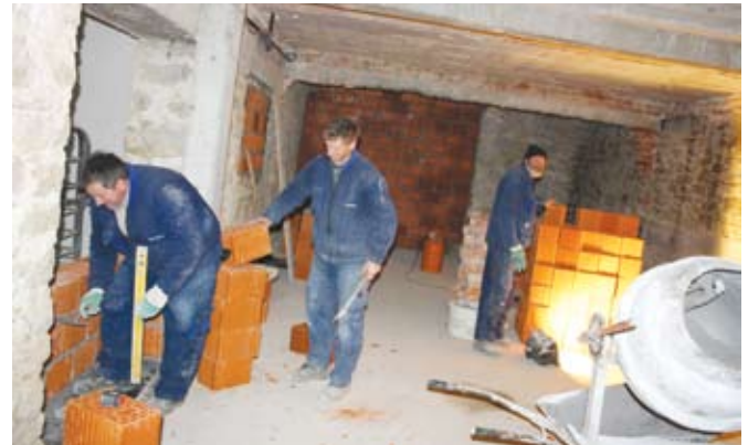
Radovi na uređenju podrumskih prostorija Doma kulture

Ovaj projekt Općina je prijavila na natječaj Ministarstva regionalnog razvoja, vrijednost tih radova iznosi 500.000,00 kuna a sredstva su osigurana u proračunu Općine Jesenje. Radove izvođe djelatnici MB-Transgradnje iz Krapine koji su putem Javnog natječaja izabrani kao najpovoljniji ponuđač.