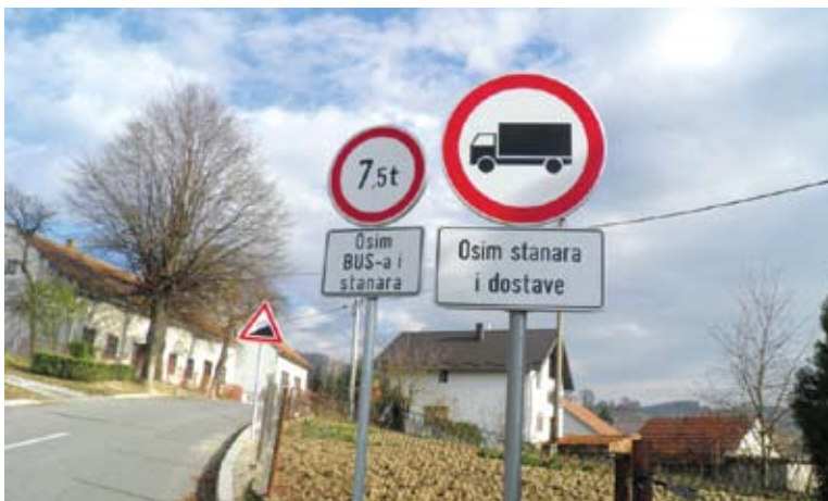
Novo postavljene prometne znakove zabranjuju promet Rimskom cestom teškim vozilima.

Pored toga sudionici u prometu upozoravaju se i na ostale uvjete odvijanja prometa na cesti kao što su usponi, zavoji i druge moguće opasnosti. Inače za zimsko održavanje ove i ostalih prometnica na području Općine Radoboj obavljene su sve potrebne pripreme, nabavljene su dovoljne količine sipine i soli i određeni su sudionici koji će čistiti snijeg kada padne.(vir)