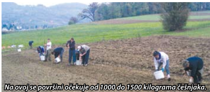
Na ovoj se površini očekuje od 1000 do 1500 kilograma češnjaka.