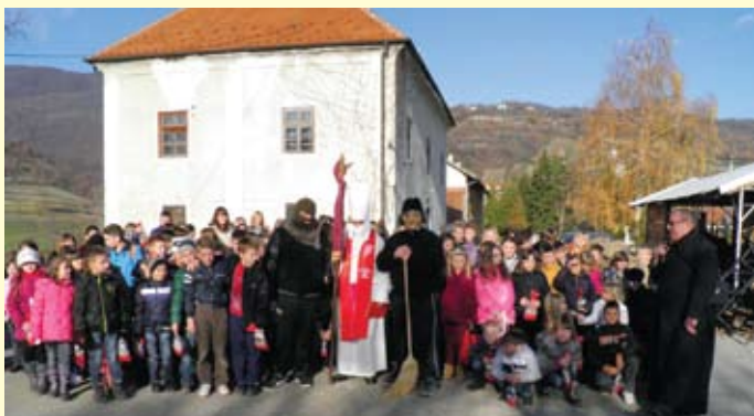
Sv. Nikola donio je darove, ali u pratnji su bila i dva krampususa.