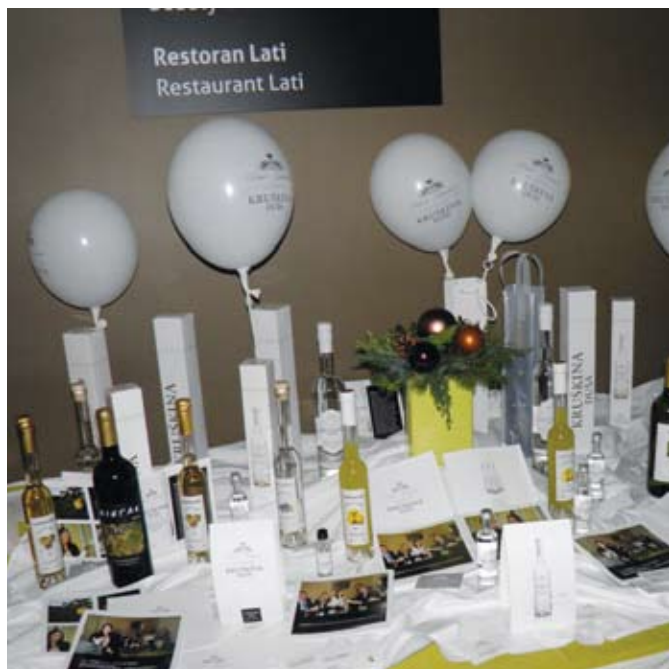
Proizvodi s radobojskih brežuljaka privukli su veliku pozornost brojnih uzvanika i gostiju hotela Well u Tuheljskim Toplicama.