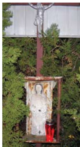
Raspelo na prvom križanju puteva od nekadašnjeg ugljenokopa Mirna do centra Radoboja na kojem je i slika sv. Barbare i ove je godine osvjetljavala svjetlost lampiona.