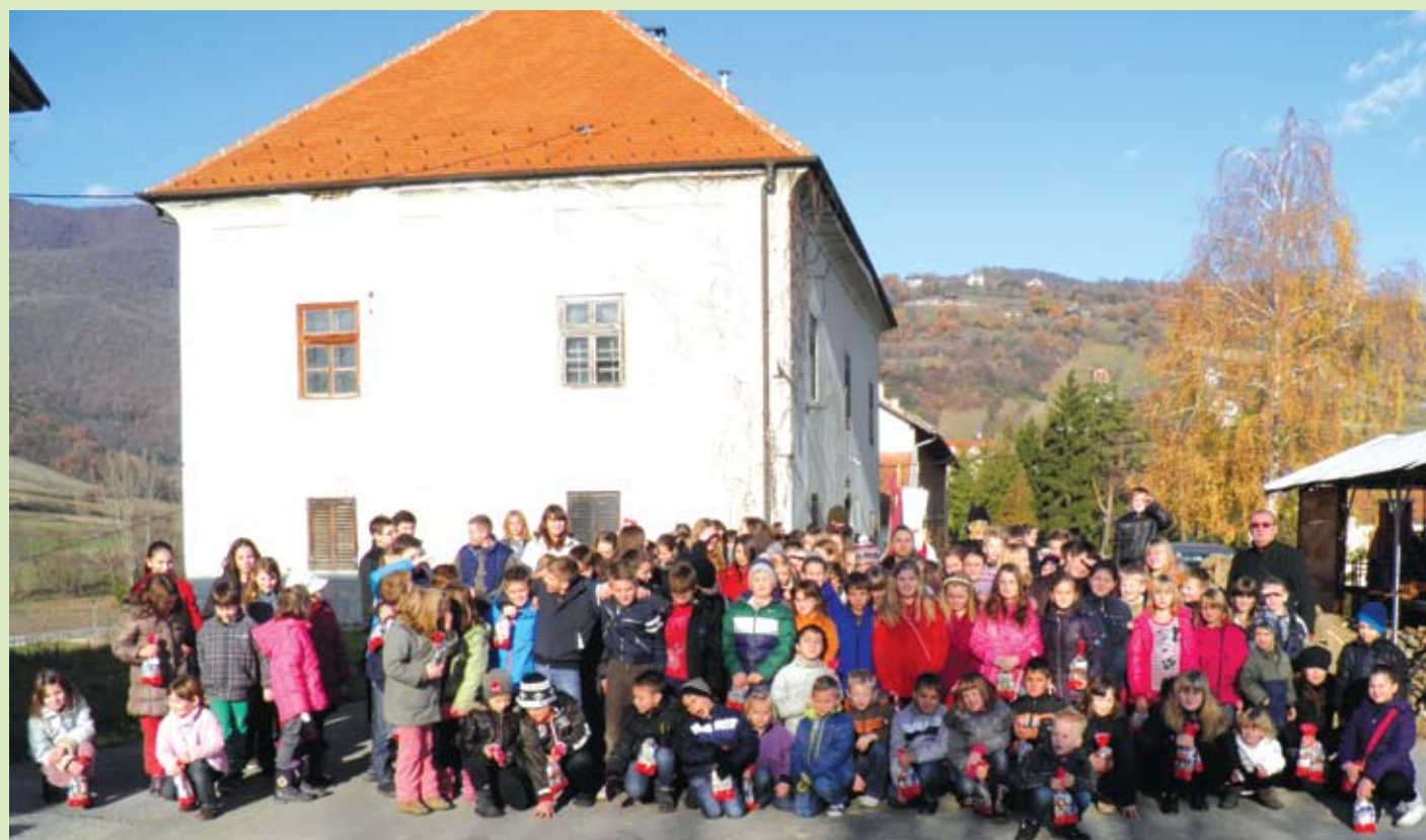
SVETI NIKOLA DONIO JE POKLONE ZA NAJMLAĐE VJERNIKE RADOBOJSKE ŽUPE Opširnije: str. 8-9