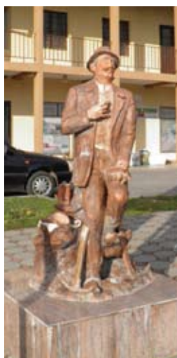
Na radobojske rudare podsjećaju i kip rudara u centru Radoboja.

OBILJEŽENA SEDAMDESETA OBLJETNICA STRADANJA NEVINIH MJEŠTANA CERJA